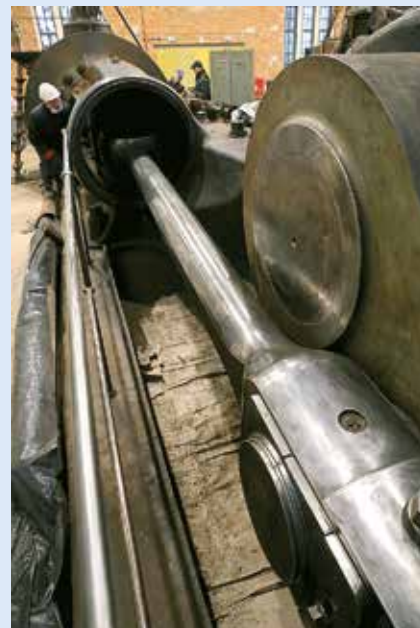
Rozmiary maszyny robią wrażenie, a co dopiero, gdy to wszystko będzie pracować pod parą

Śruba po śrubie, część po części z anielską cierpliwością czyszczą