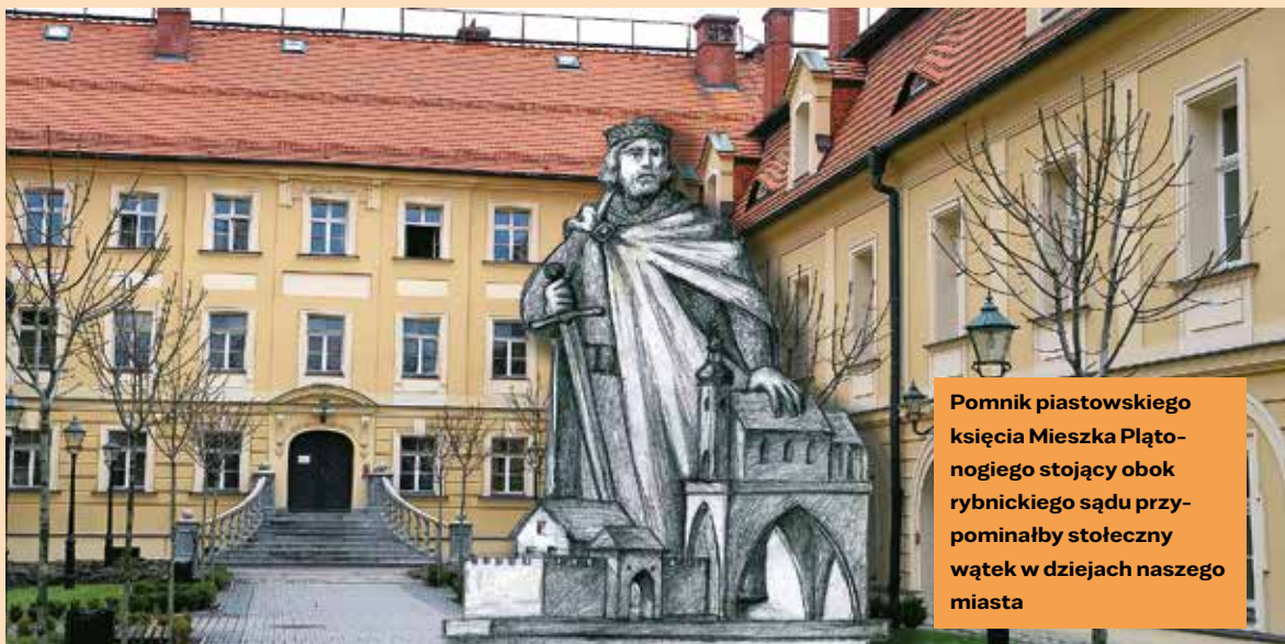
Pomnik piastowskiego księcia Mieszka Piłtoniego stojący obok rybnickiego sądu przypominałby stołeczny wątek w dziejach naszego miasta

Wróćmy jednak do czasów księcia Piłtoniego, bo to wtedy Rybnik był tak ważnym miejscem na mapie regionu jak nigdy wcześniej ani później. Po drodze jednak parę razy nasze miasto zdobyło ponadmiejskie uznanie. Niewątpliwie było to w 1818 roku, gdy powstał powiat rybnicki, a Rybnik – wprawdzie z przerwami – ale był jego stolicą. Nie możemy również zapomnieć o tym, że około 1952 roku powstał Rybnicki Okręg Węglowy ze „stolicą” w Rybniku. Choć różnie ten okres z gospodarczego punktu widzenia jest oceniany, to jednak miasto na tym zyskało przez przeróżne inwestycje, jak budowa elektrowni, nowych kopalń, dróg i szkół... I choć dzisiaj formalnie ROW już nie istnieje, to jednak jego ostatecznym i symbolicznym końcem będzie planowane na rok 2049 zamknięcie dwóch ostatnich śląskich kopalń w Chwałowicach i Boguszowicach. Takie przynajmniej są plany.