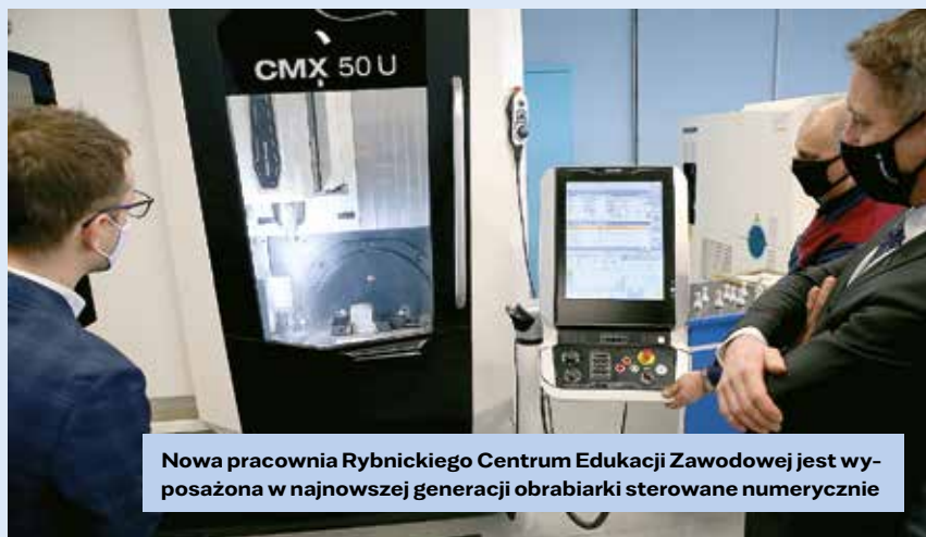
Nowa pracownia Rybnickiego Centrum Edukacji Zawodowej jest wyposażona w najnowszej generacji obrabiarki sterowane numerycznie