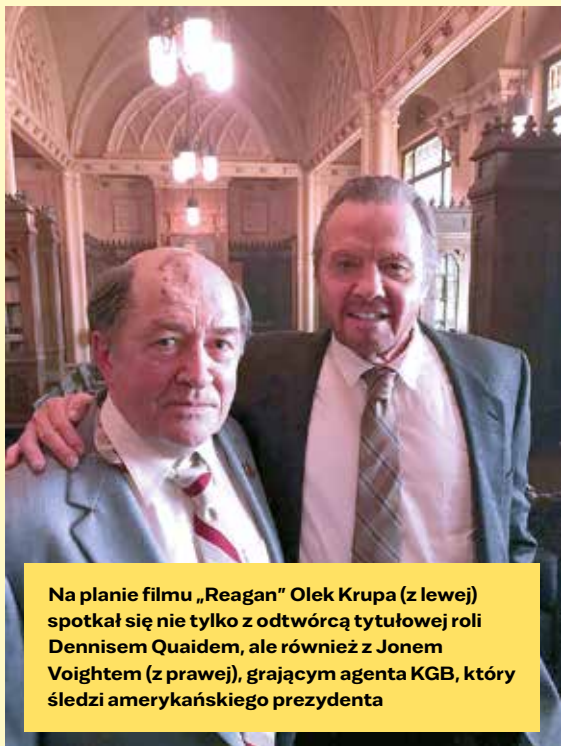
Na planie filmu „Reagan” Olek Krupa (z lewej) spotkał się nie tylko z odtwórcą tytułowej roli Dennisem Quaidem, ale również z Jonem Voightem (z prawej), grającym agenta KGB, który śledzi amerykańskiego prezydenta