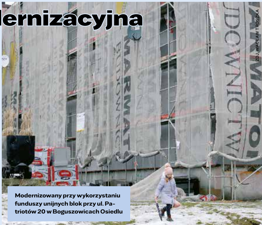
Modernizowany przy wykorzystaniu funduszy unijnych blok przy ul. Patriotów 20 w Boguszowicach Osiedlu