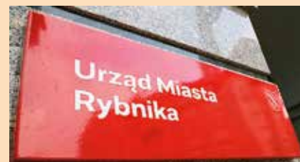
Emaliowane tabliczki, nawiązujące, jak przekonują projektanci ze Studia Otwartego, do historii rybnickiej Huty Silesia pojawiły się już na frontowej ścianie urzędu miasta.