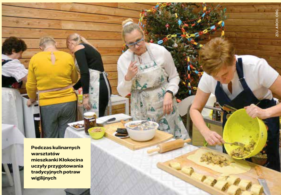
Podczas kulinarnych warsztatów mieszkanki Kłokocina uczyły przygotowania tradycyjnych potraw wigilijnych