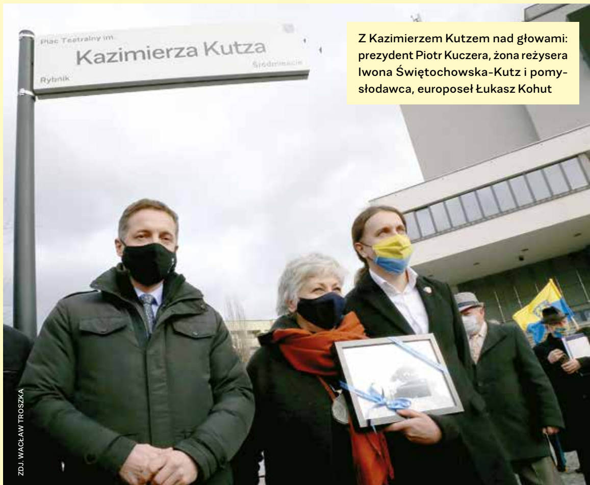
Z Kazimierzem Kutzem nad głowami: prezydent Piotr Kuczera, żona reżysera Iwona Świętochowska-Kutz i pomyślodawca, europoseł Łukasz Kohut