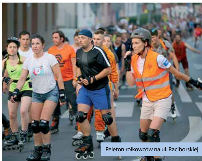
Peleton rolkowców na ul. Raciborskiej