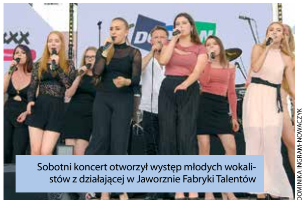
Sobotni koncert otworzył występ młodych wokalistów z działającej w Jaworznie Fabryki Talentów