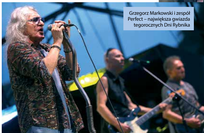
Grzegorz Markowski i zespół Perfect – największa gwiazda tegorocznych Dni Rybnika