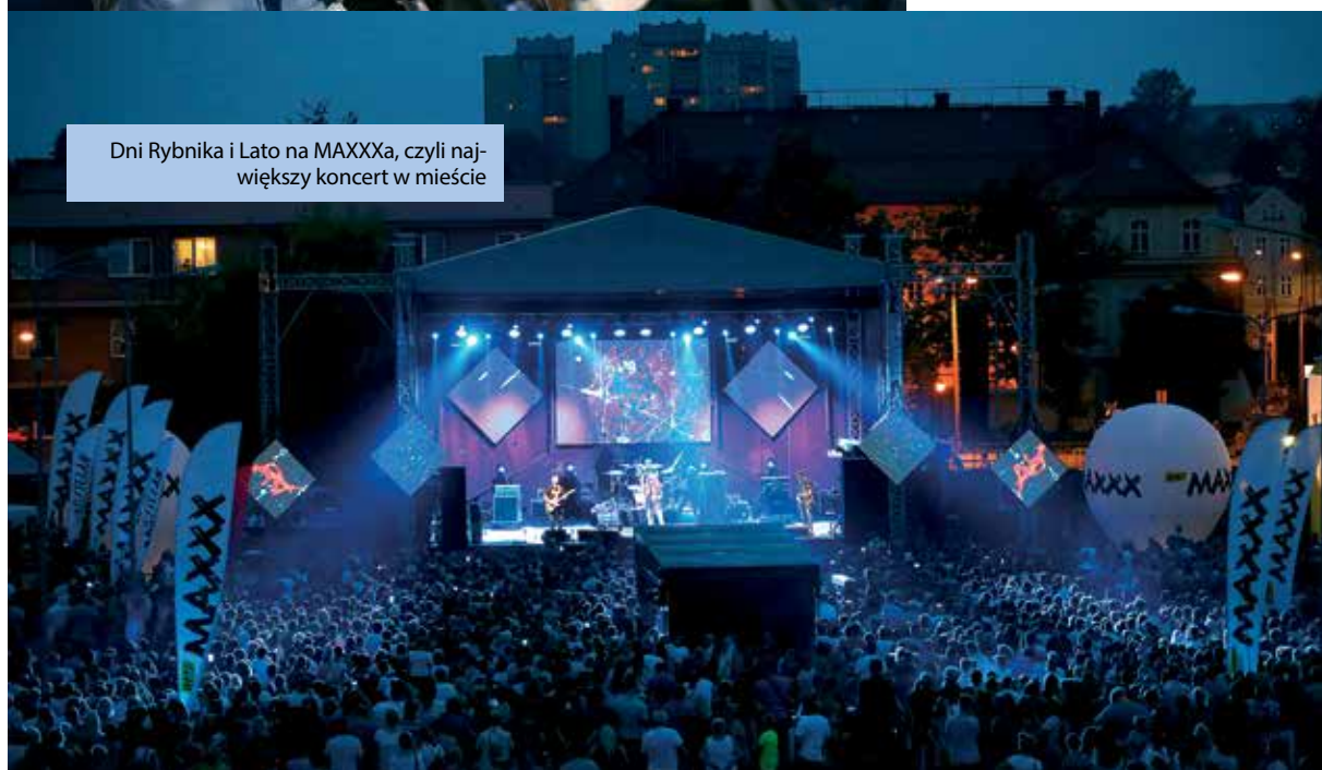
Dni Rybnika i Lato na MAXXXa, czyli największy koncert w mieście