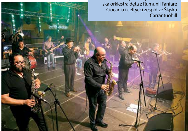
Dali czadu! Na rynkowej scenie bałkańska orkiestra dęta z Rumunii Fanfare Ciocarlia i celtycki zespół ze Śląska Carrantuohill

To bez wątplenia był najbardziej żywiołowy koncert tegorocznych Dni Rybnika. W piątkowy wieczór 14 czerwca na rynkowej scenie wystąpiła bałkańska, a konkretnie rumuńska orkiestra dęta Fanfare Ciocarlia, i nasz folkowy zespół grający muzykę celtycką Carrantuohill. Koncert miał formułę przyjacielskiego muzycznego pojedynku, zakończonego wspólnym wykonaniem utworu będącego kompilacją kompozycji z repertuarów obu grup. Oczarowana publiczność długo nie pozwalała muzykom zejść ze sceny. To był już czwarty wspólny ich występ. Pierwszy miał miejsce w 2012 roku w naszym Kampusie. Potem grali razem m.in. na Woodstocku u Jurka Owsiaaka oraz w sali NOSPR-u w Katowicach. (WAT)