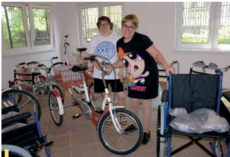
W powstałej na tyłach Warsztatów Terapii Zajęciowej nr 1 wypożyczalni sprzętu rehabilitacyjnego praktyki zawodowe odbywają niepełnosprawni warsztatowicze

W lipcu i w pierwszej połowie sierpnia w urzędzie miasta nie będą wydawane rybnickie karty seniora. Ponownie będzie je można otrzymać począwszy od 20 sierpnia, tradycyjnie od godz. 10 do 12, podczas cyklicznych wtorkowych dyżurów Rybnickiej Rady Seniorów (Urząd Miasta Rybnika, ul. Bolesława Chrobrego 2, pok. 213).