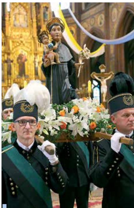
Procesja ulicami miasta z figurą patrona Rybnika św. Antoniego to kulminacyjny punkt obchodów święta naszego miasta