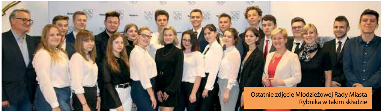
Ostatnie zdjęcie Młodzieżowej Rady Miasta Rybnika w takim składzie