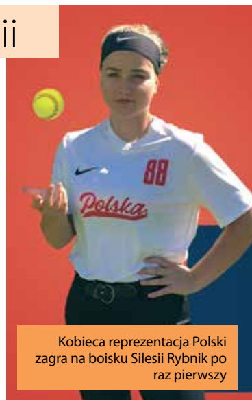
Kobieca reprezentacja Polski zagra na boisku Silesii Rybnik po raz pierwszy

Oprócz medali ME nagrodą dla najlepszych będzie możliwość rywalizacji o przepustki na igrzyska w 2020 roku. Sześć najlepszych zespołów turnieju wystąpi w turnieju