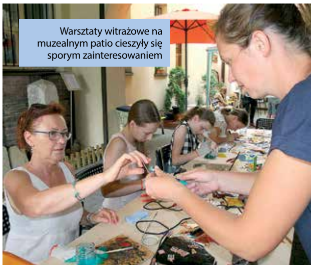
Warsztaty witrażowe na muzealnym patio cieszyły się sporym zainteresowaniem