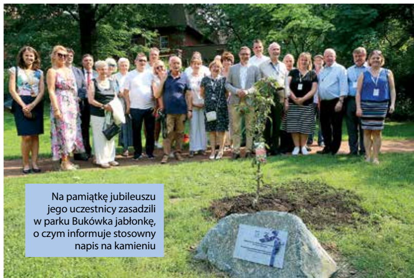
Na pamiątkę jubileuszu jego uczestnicy zasadzili w parku Bukówka jabłonię, o czym informuje stosowny napis na kamieniu