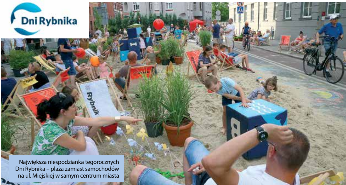
Największa niespodzianka tegorocznych Dni Rybnika – plaża zamiast samochodów na ul. Miejskiej w samym centrum miasta