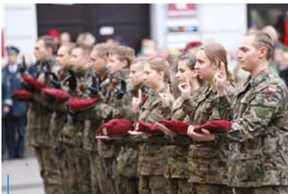
W czasie niepodległościowego świętowania na rynku uroczyste ślubowanie złożyli członkowie patriotycznego stowarzyszenia młodzieży polskiej Task Force 13 Scorpion