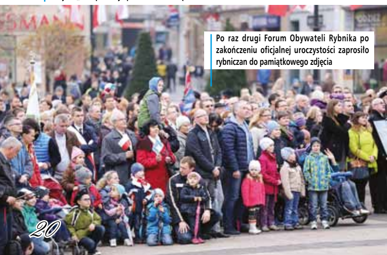
Po raz drugi Forum Obywateli Rybnika po zakończeniu oficjalnej uroczystości zaprosiło rybniczanie do pamiątkowego zdjęcia