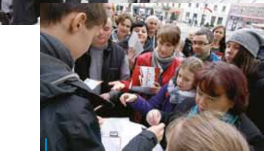
Sporym zainteresowaniem mieszkańców cieszyła się zorganizowana przez magistrat wspólnie z harcerzami tzw. gra miejska „Listopadowy spacer w z historią w tle”