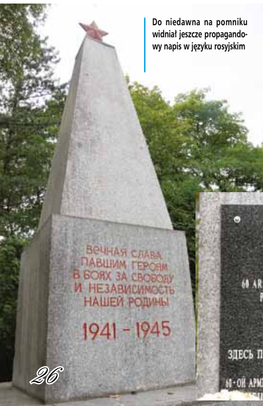
Do niedawna na pomniku widniał jeszcze propagandowy napis w języku rosyjskim

Nowa polsko-rosyjska tablica zainstalowana krótko przed dniem Wszystkich Świętych