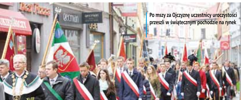
Po mszy za Ojczyznę uczestnicy uroczystości przeszli w świątecznym pochodzie na rynek