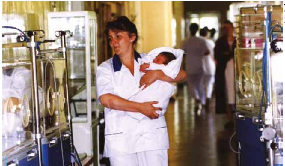
W roku 2000 miała miejsce pamiętna przeprowadzka oddziałów z trzech wiekowych szpitali do nowego kompleksu w Orzepowicach. Przeprowadzili się wtedy również najmniejsi pacjenci – noworodki urodzone w budynku przy ul. Powstańców Śl., w którym dziś mieści się Państwowa Szkoła Muzyczna I i II stopnia

1 stycznia 1996 roku, na mocy porozumienia z wojewodą, z ZOZ-u wydzielono jednostki