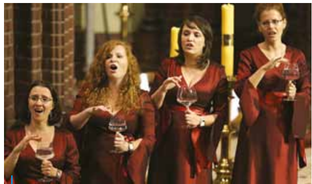
Laureaci Grand Prix – chór z Akademii Techniczno-Humanistycznej z Bielska-Białej