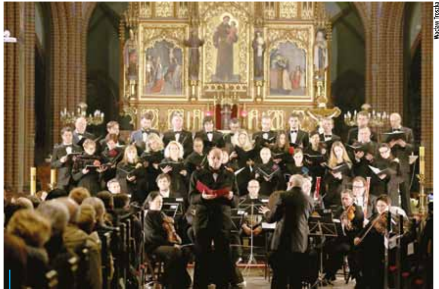
Koncert zakończyło Requiem Gabriela Fauré z udziałem orkiestry, chóru i solistów