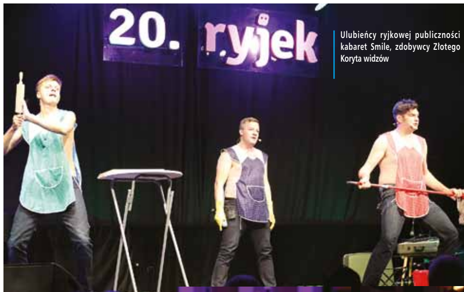
Ulubieńcy ryjkowej publiczności kabaret Smile, zdobywcy Złotego Koryta widzów

Gospodarzem „DwudziestoRYCIA” był Kabaret Młodych Panów, który pokazał też jeden ze swoich najnowszych skeczy