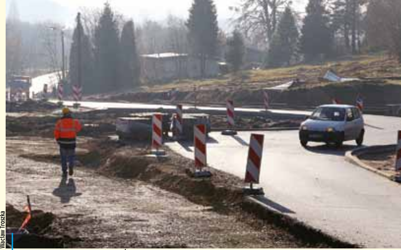
Pierwsza połówka ronda na ul. Świerkłańskiej jest już prawie gotowa

⚠ Jedną z większych trwających inwestycji jest przebudowa ul. Zwycięstwa w Chwałowicach, na odcinku od ogródków działkowych do skrzyżowania z ul. Tkoczów. W ramach tego zadania przebudowana zostanie część drogową, kanalizacja, oświetlenie uliczne i sieć elektroenergetyczna. Roboty wartości prawie 2,7 mln zł wykonuje firma Skanska SA. Ich zakończenie