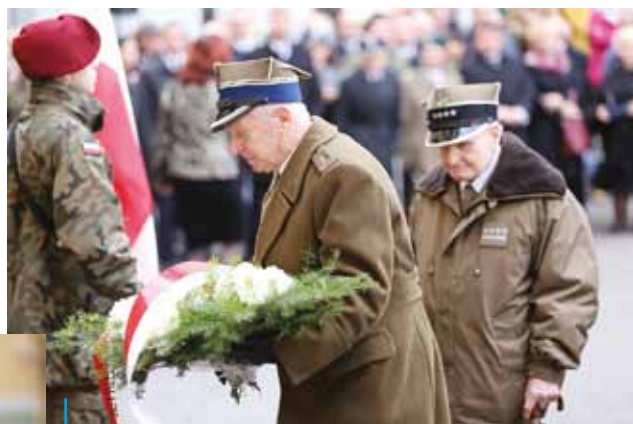
Po przemówieniu prezydenta Rybnika złożono kwiaty pod historycznymi tablicami na ścianie frontowej ratusza. Zrobili to m.in. przedstawiciele organizacji kombatanckich