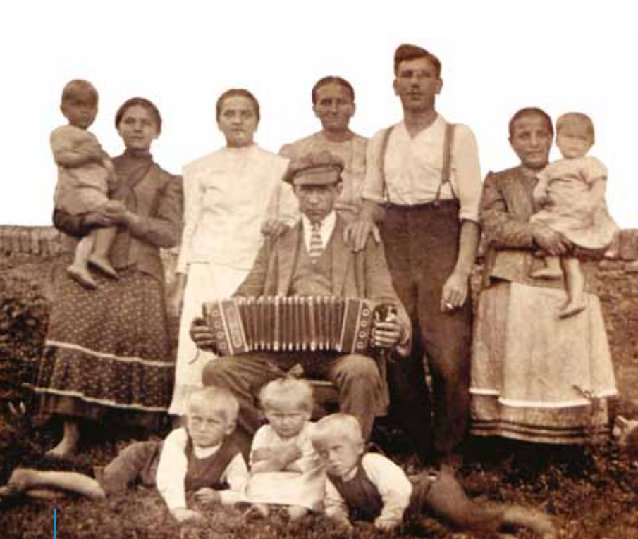
Fotografia rodzinna z harmoszką na knefle, czyli harmonijką guzikową. Okolice Pszczyny, rok 1925

Tekst, zdjęcie i fotokopia: Marek Sołtysek