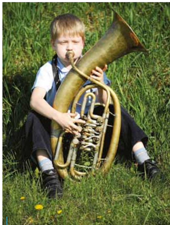
Bajtel bawi się graniem na trąbie od bracka. Trąbami nazywa się ogólnie wszystkie instrumenty dęte blaszane, ale konkretnie w tym przypadku chłopak gra na tenorze