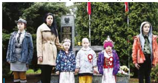
Świętowano też w Chwałowicach, tradycyjnie pod pomnikiem, z harcerzami i przed-szkołakami