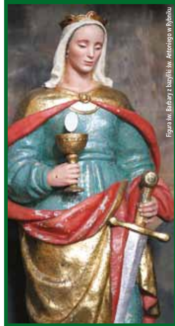
Figura św. Barbary z bazyliki św. Antoniego w Rybniku

Z okazji zbliżającej się Barbórki wszystkim Górnikom i ich bliskim życzymy opieki ich patronki św. Barbary. Szczęść Boże!