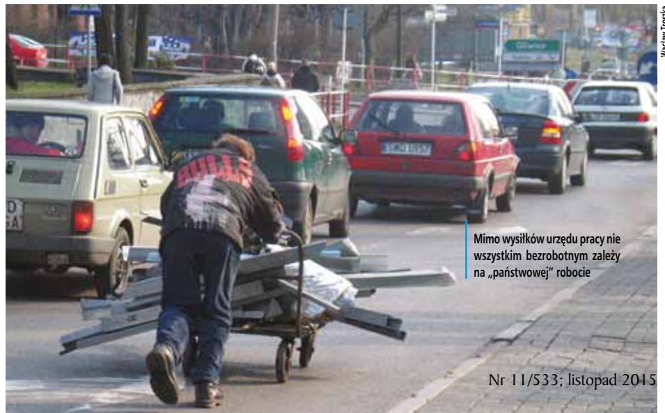
Mimo wysiłków urzędu pracy nie wszystkim bezrobotnym zależy na „państwowej” robocie