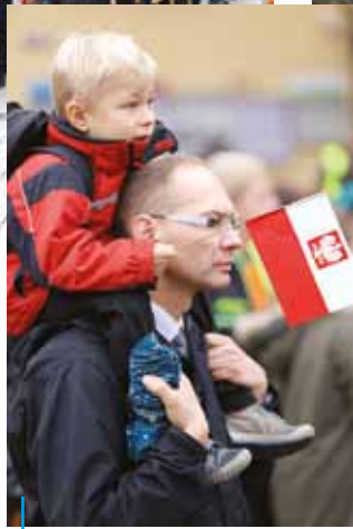
Najbardziej cieszy widok mieszkańców, którzy na uroczystości związane z naszymi świętami państwowymi przychodzą całymi rodzinami