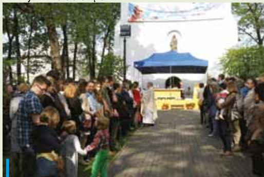
27 kwietnia w dniu kanonizacji Jana Pawła II rybniczanie w czasie wyjątkowej mszy św. dziękowali za jego pontyfikat