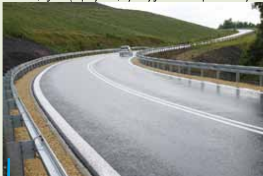
Droga przez kopalniane zwałowisko połączyła dzielnice Meksyk i Bogusowice Stare