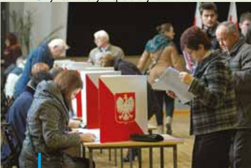
16 listopada odbyła się pierwsza tura wyborów samorządowych. Najlicniejszym klubem w radzie miasta Blok Samorządowy Rybnik