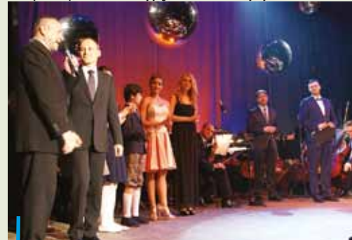
50-lecie Teatru Ziemi Rybnickiej świętowano w czasie październikowej, muzyczno-tanecznej gali