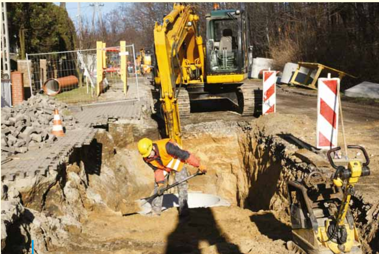
Modernizacja pierwszego odcinka ulicy Sportowej rozpoczęła się od budowy kanalizacji deszczowej

⚠ Trwa budowa kanalizacji deszczowej w ciągu ul. Błękitnej zbierająca deszczówkę również z nowej drogi nazywanej roboczo drogą „przez zwał”. Ponieważ jest ona przedłużeniem ul. Tkoczów, taką też prawdopodobnie otrzyma oficjalną nazwę, ale to już leży w kompetencjach rady miasta.