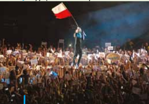
Czwarty duży koncert zagranicznej gwiazdy na Stadionie Miejskim. Zagrał amerykański zespół 30 Sekund do Marsa