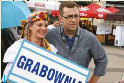
Korowód dzielnic odbywający się tradycyjnie w czas Dni Rybnika wygrała mała Grabownia, a gwiazdą imprezy został, kojarzony głównie z Teleexpresem Maciej Orłós