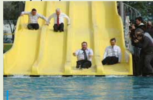
1 czerwca otwarto budowane od nowa, nowoczesne kąpielisko Ruda. Oficjalnie nie ominęła przymusowa kąpiel