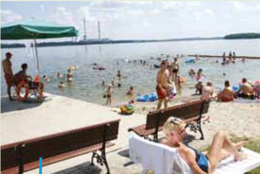
Nowy właściciel dawnego elektrownianego ośrodka w Stodolach zorganizował nad Zalewem Rybnickim prywatną plażę