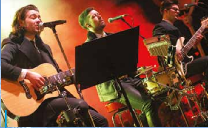
Muzyczną gwiazdą wigilijki dla mieszkańców na rynku był zespół Pectus