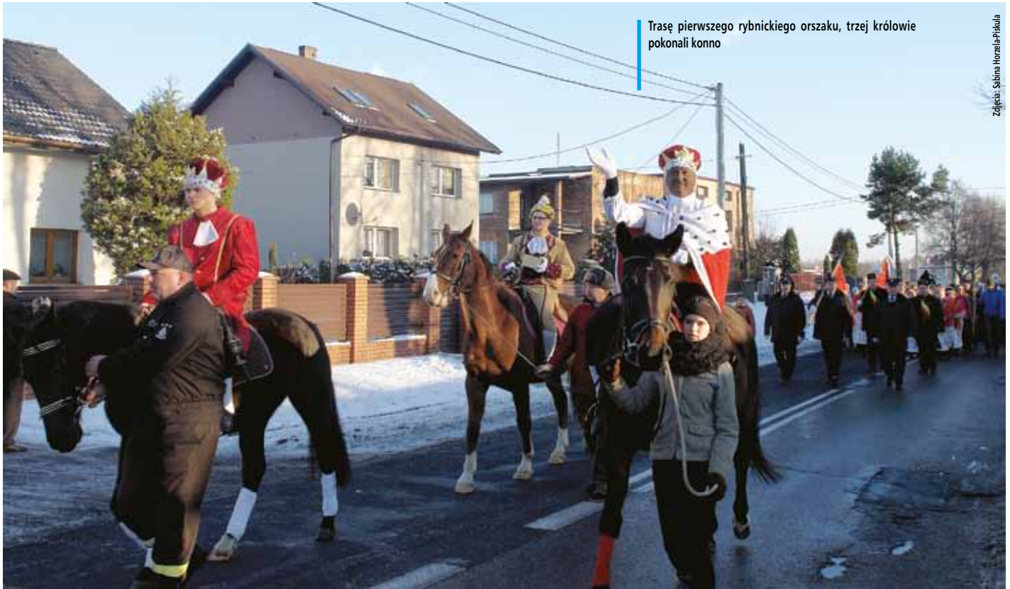
Trasę pierwszego rybnickiego orszaku, trzej królowie pokonali konno