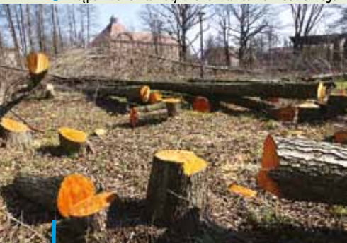
Budowa parku tematycznego nad Nacyną rozpoczęła się od bolesnej dla wielu mieszkańców wycinki drzew