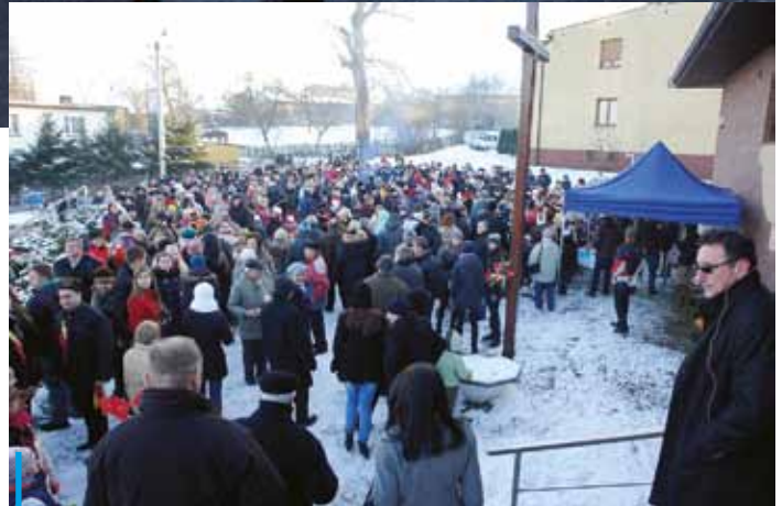
... i wspólnie świętowało na placu przed kościołem