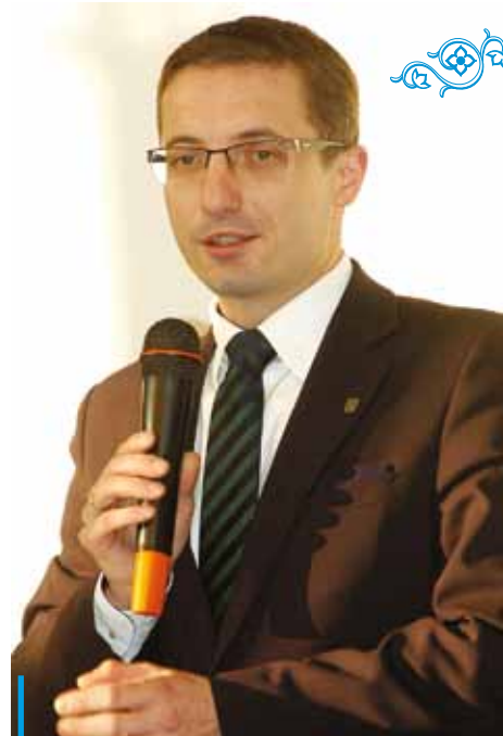
Prezydent Piotr Kuczera zaczyna wprowadzać w życie nowe pomysły na zarządzanie miastem

Z tzw. raportów otwarcia, które dla nowo wybranego prezydenta przygotowali naczelnicy magistrackich wydziałów wynika, że w kilku przypadkach wzrost liczby załatwianych spraw jest tak duży, że wkrótce koniecznością będzie zatrudnienie kolejnych pracowników. Nowością będą comiesięczne narady naczelników wszystkich magistrackich wydziałów oraz szefów kluczowych jednostek miejskich, mające zapewnić wzajemną wymianę informacji.