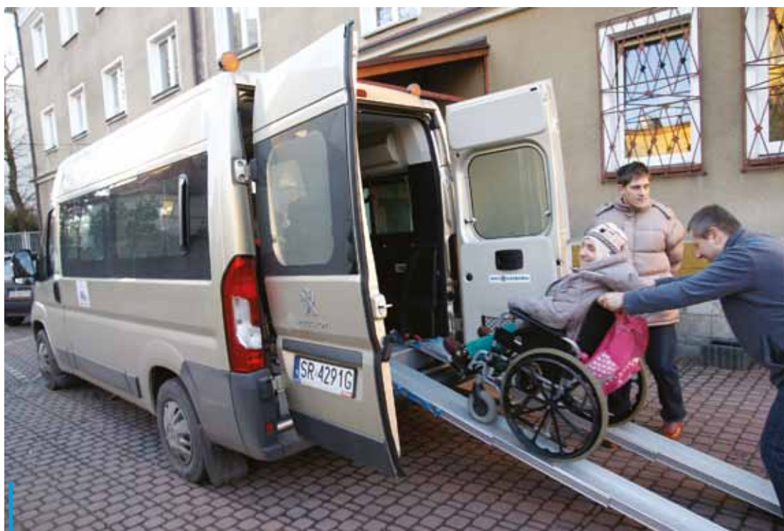
Akcja WTZ Przystań „Zbieramy na busa” zakończyła się sukcesem. Nowy pojazd już dowozi na zajęcia niepełnosprawnych uczestników WTZ nr 1