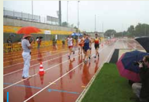
Gruntownie zmodernizowany stadion lekkoatletyczny zmienił się nie do poznania, niestety jego otwarciu towarzyszyła ulewa