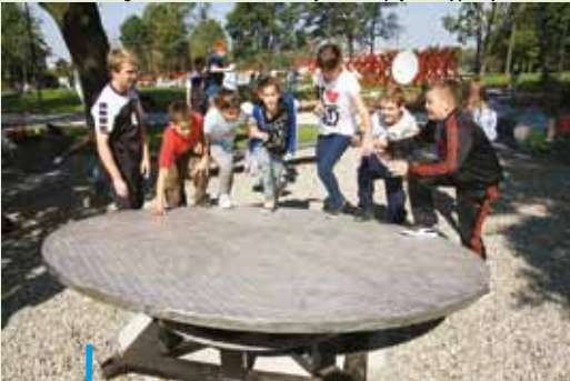
Park przyrody i nauki nad Nacyną, czyli tzw. park tematyczny to nowe, ciekawe miejsce na mapie Rybnika