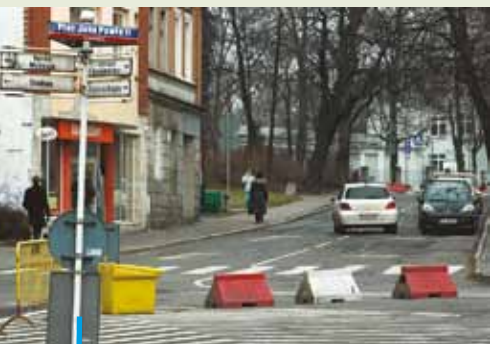
Komunikacyjna rewolucja wokół bazyliki św. Antoniego była wstępem do rewitalizacji ulic Powstańców Śl. i Sobieskiego