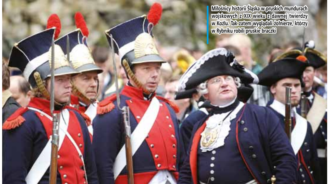
Miłośnicy historii Śląska w pruskich mundurach wojskowych z XIX wieku z dawnej twierdzy w Koźlu. Tak i zatem wyglądali żołnierze, którzy w Rybniku robili pruskie braczki

Słusznie Ślązoki narzekają na programy polskiego szkolnictwa, w których o Śląsku nie ma prawie nic. Nie ma też chyba szans, by nasze niezbyt zamożne państwo wprowadziło do śląskich szkół kilka dodatkowych godzin nauczania śląskiej mowy czy historii. A jeżeli nawet to zostanie wprowadzone, to mogą to być przedmioty nie oceniane, bez wpisu na świadectwa, a materiał ten nie będzie obowiązywał na szkolnych egzaminach, zwłaszcza na maturze. Tym samym zrobi się z nauczanych śląskich spraw przedmioty drugorzędne – jak śpiew czy plastyka. Może to przynieść efekt odwrotny od zamierzonego. Dlatego jako realista, jestem zwolennikiem uczenia w szkołach śląskiej kultury metodą „okienek”. Czyli ucząc w szkole jakiegoś zagadnienia będącego częścią obowiązkowego materiału nauczania, nauczyciel opowiada dodatkowo – jakby w okienku, jakby w ramce obok