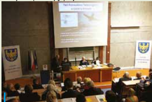
Na początku maja w rybnickim ośrodku Uniwersytetu Ekonomicznego odbyła się wyjazdowa sesja Sejmiku Województwa Śląskiego