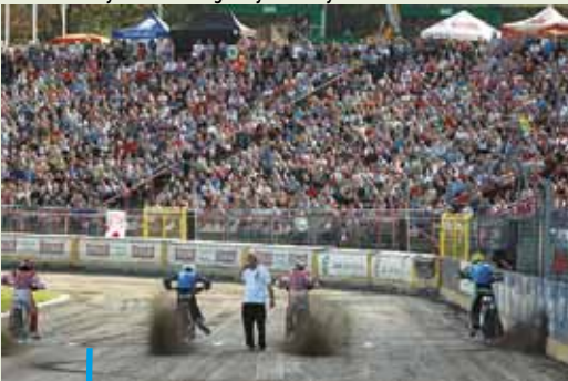
Komplet publiczności oglądał na Stadionie Miejskim październikowy mecz żużlowych reprezentacji Polski i świata