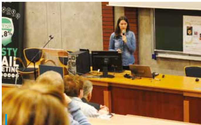
Debatę na temat kompetencji cyfrowych młodych rybniczian odbyła się w auli Uniwersytetu Ekonomicznego

O cyfrowych tubylcach, „webskich” nauczycielach, mailach phishingowych, dronach i pokoleniu Z, słowem o nowoczesnych technologiach i rozwoju świadomości internetowej rozmawiano 19 grudnia w auli Uniwersytetu Ekonomicznego. Debatę na temat kompetencji cyfrowych młodych rybniczian zorganizował Ośrodek Pomocy Społecznej i fundacja Imago w ramach realizowanego przez nie projektu „Nowa perspektywa osób zagrożonych wykluczeniem społecznym w wieku 15-27 lat z Rybnika”.