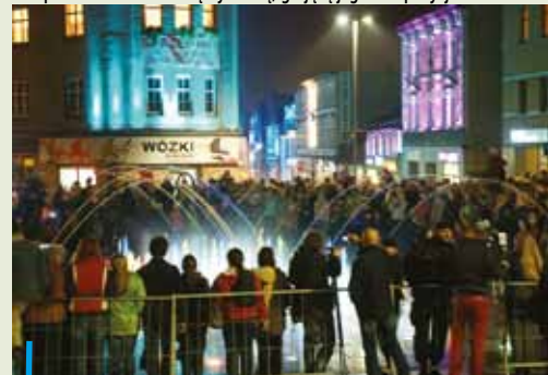
Przy użyciu laserów i efektownych iluminacji otwarto śródmiej-ski deptak i gruntownie odnowiony pl. Jana Pawła II