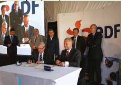
Koncernem EDF, francuski właściciel rybnickiej elektrowni z pompą rozpoczął jej modernizację. Wcześniej przymierzał się do budowy nowej elektrowni