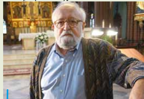
W bazylice św. Antoniego maestro Krzysztof Penderecki poprowadził Filharmonię Rybnicką, grającą jego kompozycje