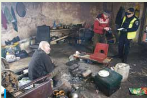
Na początku roku w całej Polsce odbyło się liczenie ludzi bezdomnych. W Rybniku doliczono się ich 122.