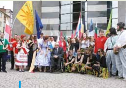
Choć z trzech uczelni w Rybniku zostały tylko dwie, w maju odbyły się w mieście doroczne juwenalia