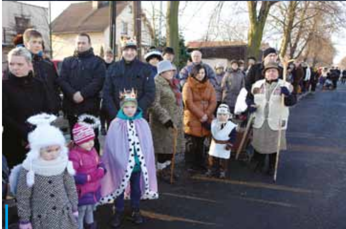
Wielu mieszkańców przebrało się w jasełkowe stroje...