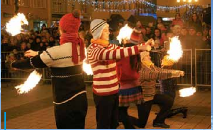
Efektowną inscenizację opowieści o dziewczynce z zapalkami przedstawiło Bractwo Ognia „Spaleni”