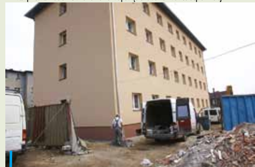
Z myślą o młodych małżeństwach zmodernizowano i rozbudowano miejski blok przy ul. Zebrzydowickiej