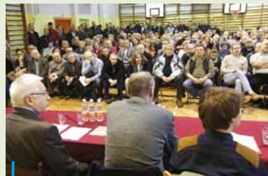
W kilku dzielnicach odbyły się spotkania z mieszkańcami, w czasie których władze miasta i przedstawiciele PEC-u namawiali ich do podłączenia domów do sieci ciepłowniczej