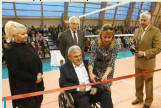
Sportowe, głównie siatkarskie, Gimnazjum nr 2, doczekało się własnej hali sportowej