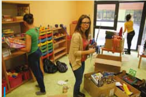
W Popielowie przedszkolaki wprowadzili się do nowego przedszkola, ale z przeprowadzki cieszą się również przedszkolanki