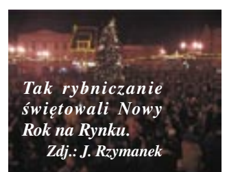
Tak rybniczanie świętowali Nowy Rok na Rynku.