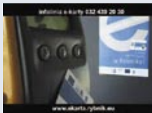
Kadr z filmu instruktażowego.

Dobiega trzeci miesiąc obowiązywania elektronicznego biletu komunikacji miejskiej. Jak wszystko co nowe, również posługiwanie się e-biletem mogło sprawiać trudności. Można przypuszczać, że najskuteczniej będzie je eliminował czas oraz zdobywane przez pasażerów doświadczenie, a także ciągle trwająca akcja informacyjna.