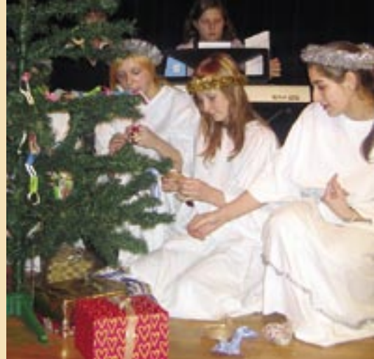
W trakcie koncertu sympatyczne aniołki dekorowały choinkę...

Tradycyjnie już, bożonarodzeniowy koncert pozwolił na zaprezentowanie efektów pracy z osobami niepełnosprawnymi oraz zaangażowania ich opiekunów i instruktorów.