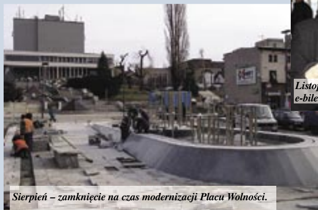
Sierpień – zamknięcie na czas modernizacji Placu Wolności.