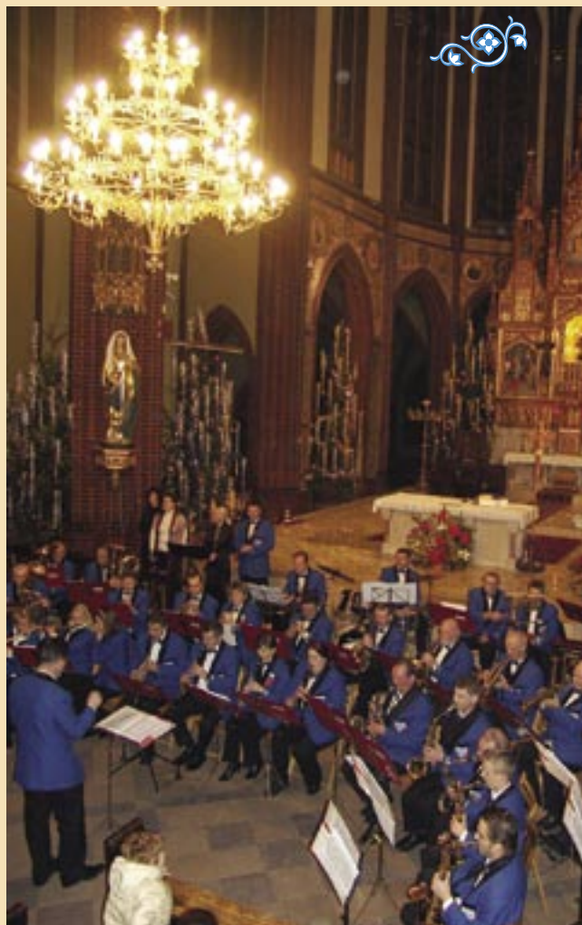
W dzień Nowego Roku w bazylice wystąpiła Miejska Orkiestra Dęta „Rybnik”.