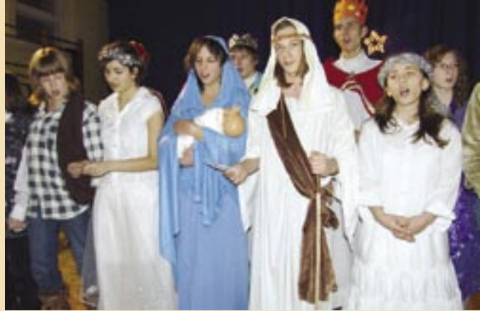
Co roku jasełka w Gimnazjum nr 3 nie tylko przypominają historię z Betlejem, ale są też pretekstem do rozważań nad prawdziwym znaczeniem świąt. Zdj.: s