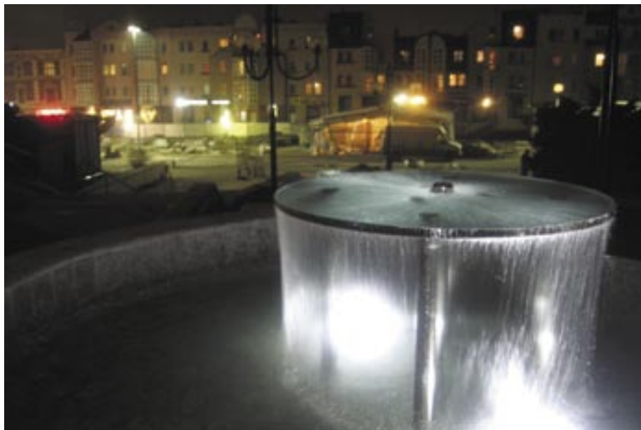
Fontanna na Placu Wolności nabierze uroku szczególnie wieczorem...