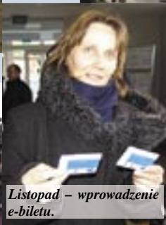
Listopad – wprowadzenie e-biletu.