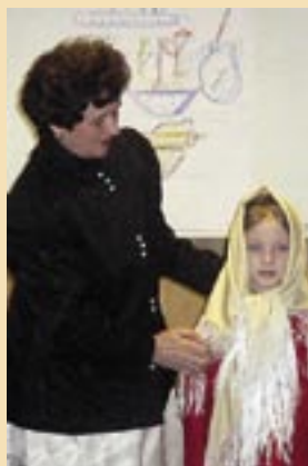
W warsztatach „Między wiarą, tradycją i obrzędem” wzięło udział 600 dzieci.