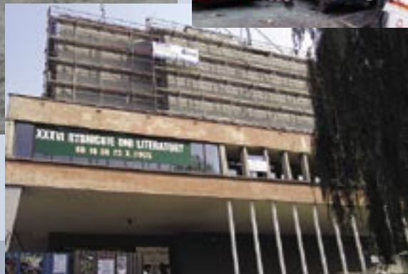
Kwiecień – rozpoczęcie modernizacji Teatru Ziemi Rybnickiej.