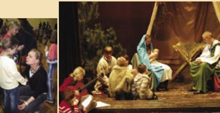
Licealiści podzielili się opłatkiem z uczniami w Świerklanach i obejrzeni jasełka „sprezentowane” im przez podopiecznych Placówki Wsparcia Dziennego przy bazylice św. Antoniego.