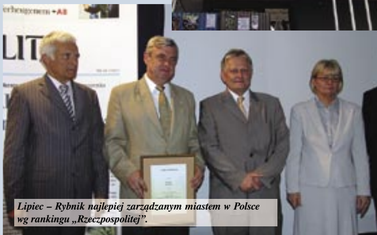
Lipiec – Rybnik najlepiej zarządzanym miastem w Polsce wg rankingu „Rzeczpospolitej”.