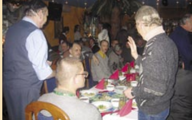
Dla wielu osób wigilia organizowana przez OPS jest jedyną okazją do tego, by zasiąść przy świątecznym stole.