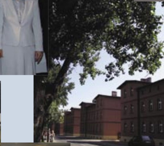
Czerwiec – początek zasiedlania wyremontowanych „familoków” w Paruszowcu-Piaskach.