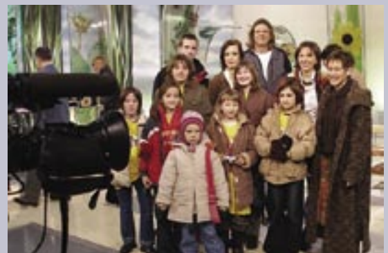
Uczniowie SP nr 19 w programie „Kawa czy herbata”.