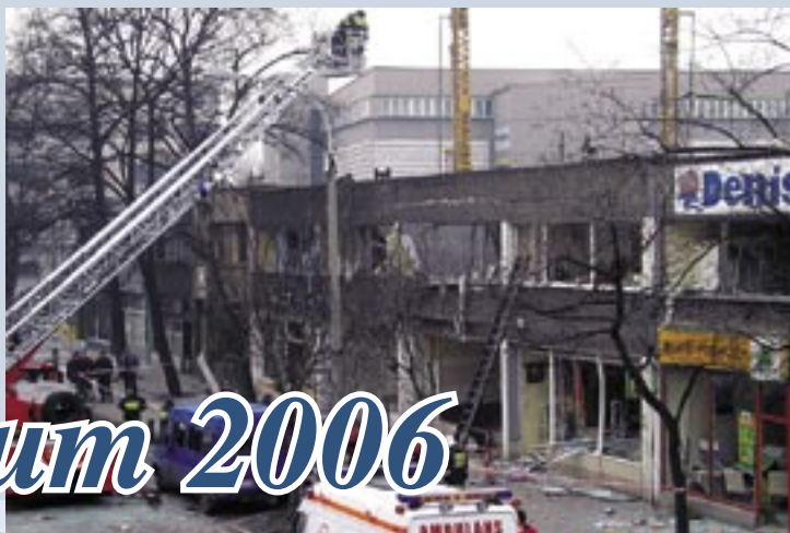
Marzec – wybuch gazu w pawilonie przy ul. 3 Maja.