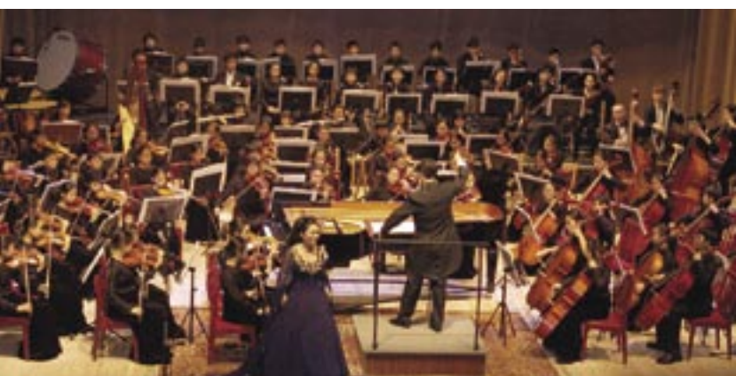
Stuosobowa orkiestra w całości wypełniła scenę.

21 lutego – Epoka lodowcowa 2 – odwilż ; 22 lutego – Auta . Seanse rozpoczynają się o godz. 10.00 , cena biletu: 8 zł za seans .