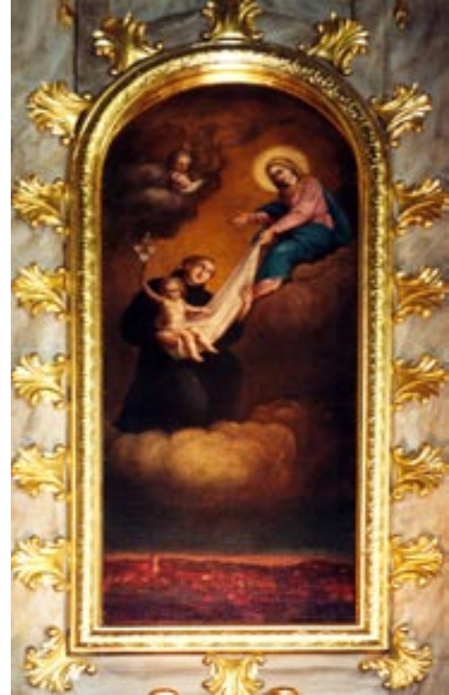
Obraz z ołtarza św. Antoniego Padewskiego w kościele Matki Boskiej Bolesnej („Starym kościele”) powstały w początkach XIX wieku. Warto zwrócić uwagę na panoramę miasta u jego dołu.

Kontakty pomiędzy miastami, wymiana towarowa i migracja ludności, a także naśladowanie wzorców życia religijnego, mogły wpłynąć na zainicjowanie kultu św. Antoniego w Rybniku, który leży w niedużej odległości od wspomnianych wcześniej miast górnośląskich, gdzie działały klasztory franciszkańskie. Zachowane ślady funkcjonowania form kultu (ołtarze, bractwa, liturgia) zdają się jednoznacznie odnosić tylko do czasów nowożytnych (XVII i XVIII wiek). W przypadku Rybnika, o oddaniu miasta pod jego opiekę, zadecydowały pożar miasta i ówczesna wielka popularność świętego wśród mieszczan i wiara w jego szczególne wstawiennictwo. W końcu XVIII wieku, wraz z budową kościoła Matki Bożej Bolesnej, podjęto decyzję o wzniesieniu istniejącego do dziś nowego ołtarza św. Antoniego. Niezwykły poprzez swoją treść i formę obraz w bocznym ołtarzu ukazuje św. Antoniego jako pośrednika pomiędzy miastem, realistycznie oddanym u dołu płótna, a małym Jezusem i Maryją. Dzieciątko ręką, w której trzyma lilie, błogosławi nasze miasto. Obraz to dowód, że już w XVIII wieku patron padewski był oficjalnym opiekunem i obrońcą Rybnika. W ten sposób umocniła się kościelna i miejska forma czci do świętego Antoniego w Rybniku. Obok niej żywiłowo rozpoczął się rozwijać kult ludowy.