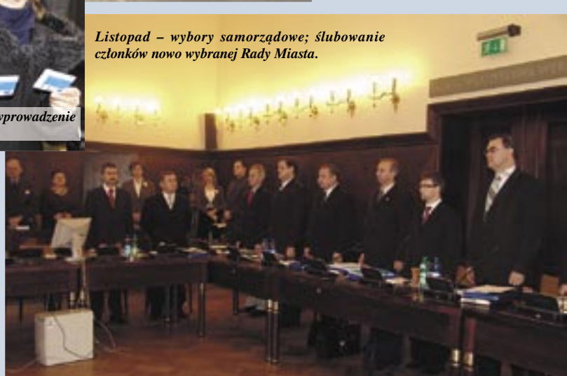
Listopad – wybory samorządowe; ślubowanie członków nowo wybranej Rady Miasta.