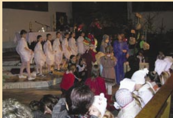
Dzieci z SP nr 19 przygotowały dla wszystkich mieszkańców Kłokocina jasełka misyjne.