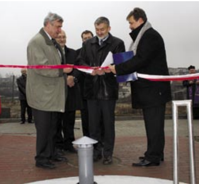
Rozruch pompowni miał uroczystą oprawę.

W ciągu dwóch lat w Radziejowie i Popielowie powstała sieć kanalizacji sanitarnej długości 49,5 km (w tym 36,2 km kanalizacji grawitacyjnej; 4,4 km kanalizacji tłocznej; 8,6 km przyłączy domowych i ponad 300 metrów zbiorników retencyjnych) oraz dwanaście przepompowni ścieków. Koszt kontraktu wyniósł