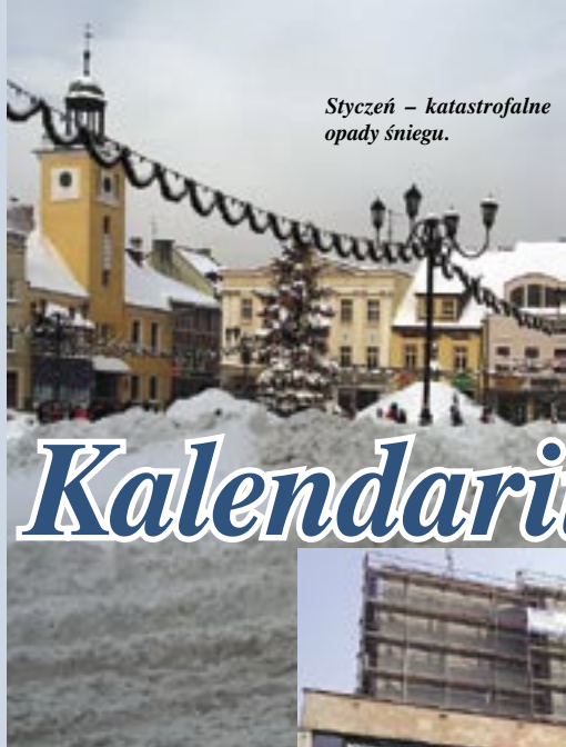
Styczeń – katastrofalne opady śniegu.