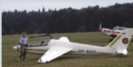
Lipiec – Mistrzostwa Europy w Akrobatyce Szybowcowej.