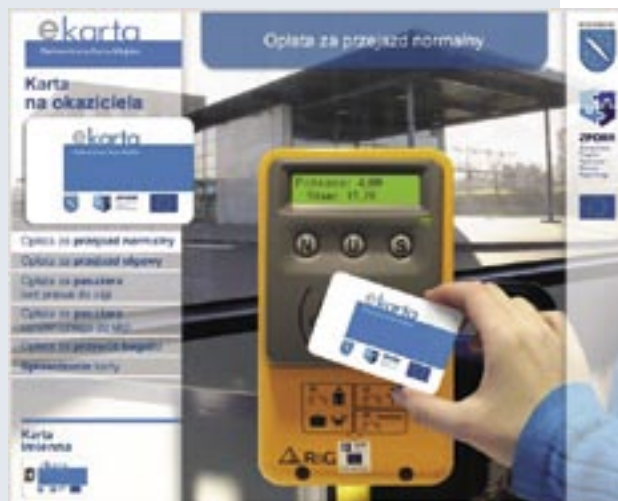
Fragment prezentacji multimedialnej.

Od momentu startu e-biletu w listopadzie ub. roku, informacje o sposobach korzystania z tej nowoczesnej formy opłaty za przejazd miejskim autobusem, można było znaleźć również w „GR”.