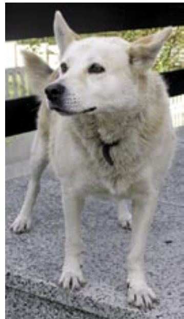
W zimie nie tylko ludzie, ale i zwierzęta potrzebują naszej pomocy...

Postawiającemu Stowarzyszeniu Meritum życzymy zaangażowania i wielu nowych, ciekawych pomysłów!