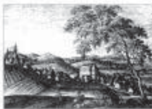
ETNOGRAFIA MIASTA JAKO PRZEDMIOT ZAINTERESOWAŃ MUZEALNICTWA POLSKIEGO

Ukazał się zbiór wystąpień naukowych pt. „ Etnografia miasta jako przedmiot zainteresowań muzealnictwa polskiego ” pod red. Genowefy Grabowskiej i Andrzeja Stawarza . Jest to rezultat konferencji naukowej, która w dniach 17–18 maja 2001 r. odbyła się w Rybniku oraz współpracy Muzeum w Rybniku i Polskiego Towarzystwa Etnologii Miasta. Spośród 40 zaproszonych na konferencję muzeów polskich tylko 7 zgłosiło referaty i komunikaty naukowe. W książce znalazło się aż 5 tekstów