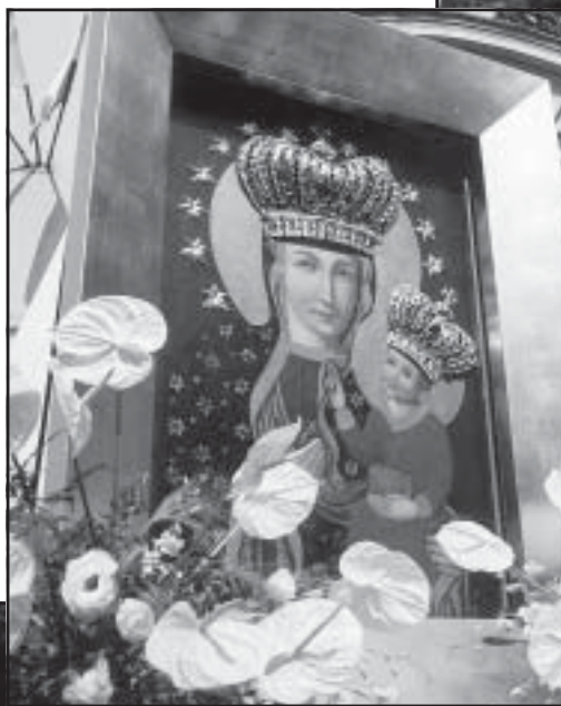
Obraz Matki Boskiej Uśmiechniętej z Pszowa już po koronacji.

Pszów to miejscowość, której korzenie sięgają XIII wieku. W istocie jednak znaczenie Pszowa na mapie Śląska datuje się od 1722 roku. Wówczas to pszowscy parafianie udali się na pielgrzymkę do Częstochowy, gdzie zakupiono kopię obrazu Jasnogórskiej Madonny. Z artystycznego punktu widzenia obraz ten musiał być lichej kondycji, gdyż już krótko po przywiezieniu został przemaalowany. Na lekko zmienionym wizerunku Matki Boskiej zagościł uśmiech i odtąd nazwano ją Matką Boską Uśmiechniętą z Pszowa. Ta pszowska Madonna stała się centrum życia religijnego dla południowej części Górnego Śląska oraz Czech, Moraw i pobliskich krain niemieckich. Niejedna pielgrzymia modlitwa została tu wysłuchana, a przy ołtarzu w pszowskim kościele nie brakuje dziękczynnych wotów. Natomiast