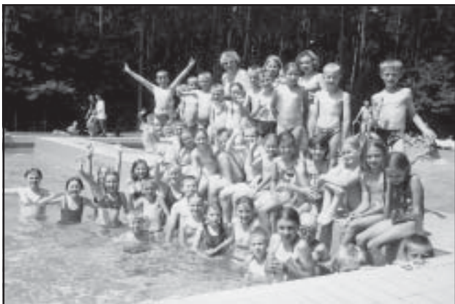
Półkoloniści podczas wycieczki na basenie w Stodolach.