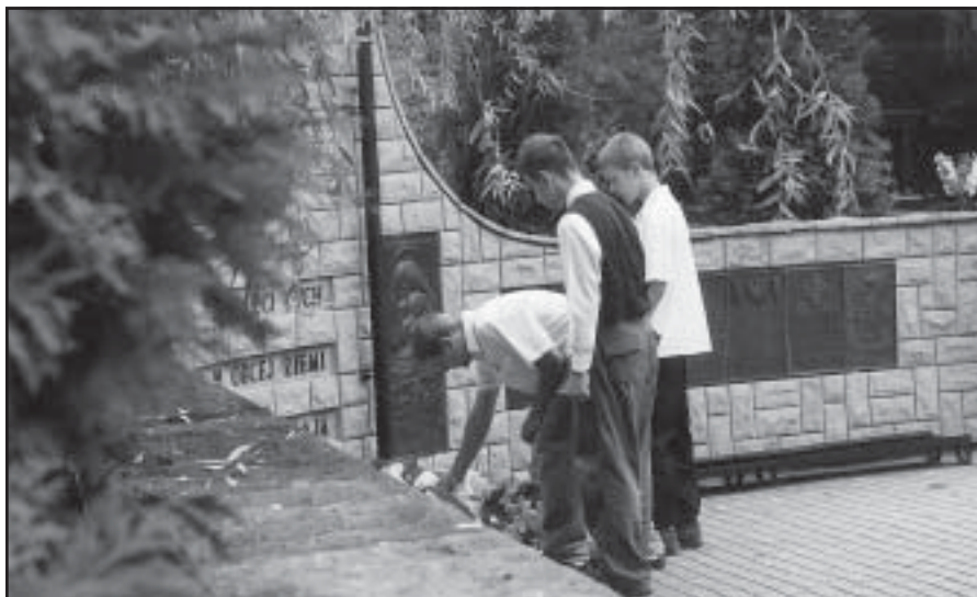
Uczniowie Gimnazjum nr 1 pamiętali o nauczycielach, którzy zginęli w Katyniu.