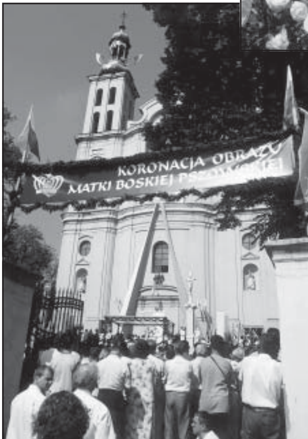
Wśród obecnych na uroczystości koronacyjnej w Pszowie nie zabrakło wielu rybniczian, a zwłaszcza pieszych pątników, którzy przyszli tam już dnia poprzedniego, a wrócili do Rybnika w niedzielę wieczorem.