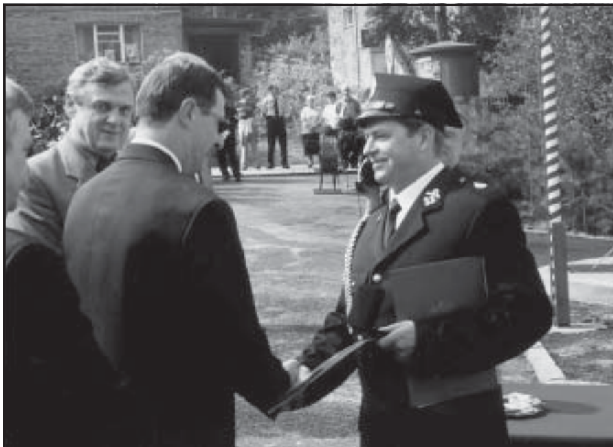
Prezes jednostki OSP w Chwałęcicach odbiera życzenia i gratulacje.

Jubileusz 75-lecia uświetniła msza święta, a zakończył festyn, który OSP zorganizowała wspólnie z Radą Dzielnicy Chwałęcice. Wśród atrakcji jakie czekały na mieszkańców były m.in. konkursy z nagrodami oraz występy artystyczne. Nie mogło zabraknąć również strażackich popisów i zabawy tanecznej, a jednym z „najjaśniejszych” punktów festynu był... pokaz sztucznych ogni. (S)