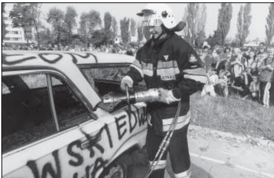
Strażacy demonstrowali dzieciom swoje umiejętności.