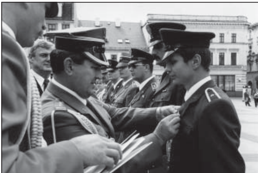
W trakcie uroczystości wręczono żołnierskie odznaczenia.

Podczas uroczystości kombatancki i weterani otrzymali akty mianowania na wyższe stopnie wojskowe. Wręczone zostały także krzyże zasługi