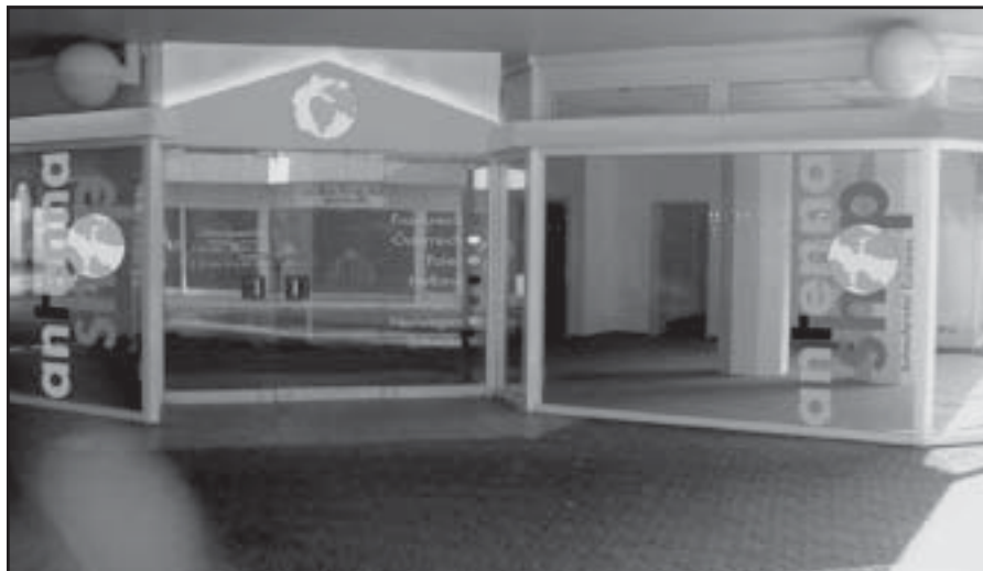
Tak przed otwarciem wyglądał Sklep Antenowy, w którym prezentują się firmy z naszego regionu.

W Dorsten zapromowało się również samo miasto Rybnik. Pomysł powstania takiego sklepu jest z pewnością trafny i stworzy okazję do pokazania potencjału firm z naszego regionu, co ułatwia znalezienie partnerów i nawiązanie kontaktów handlowych. (S)