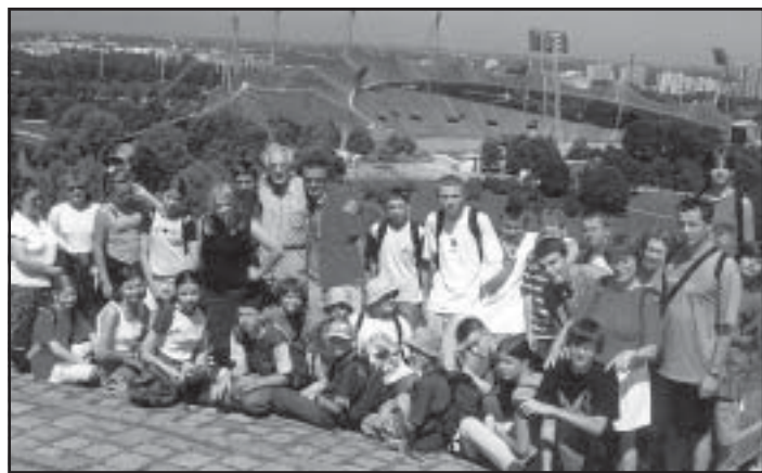
Młodzi rybniczanie zwiedzili Park Olimpijski w Monachium.