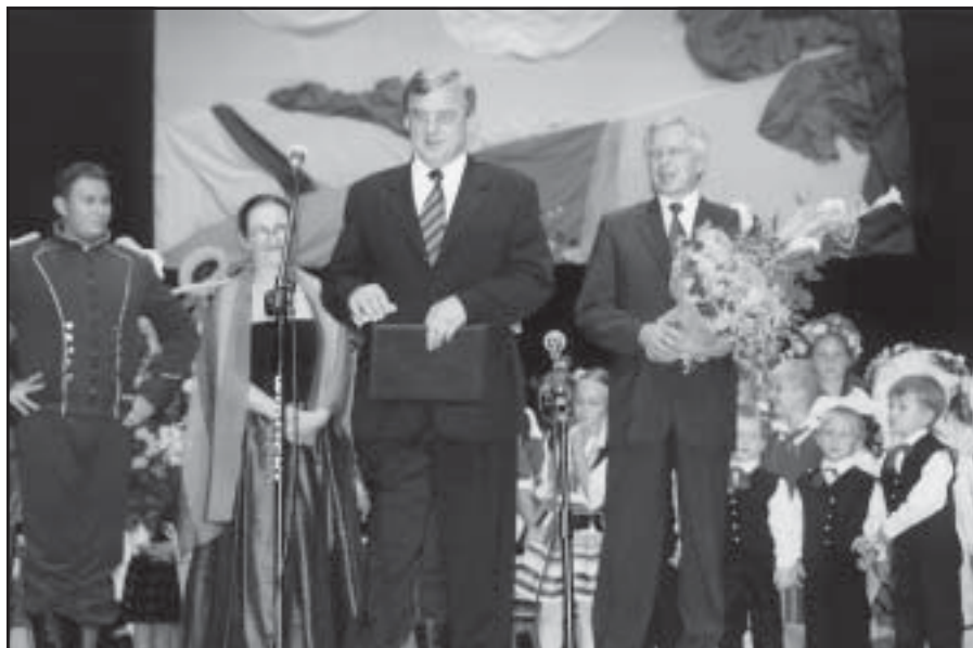
Podczas jubileuszowego koncertu w TZR.