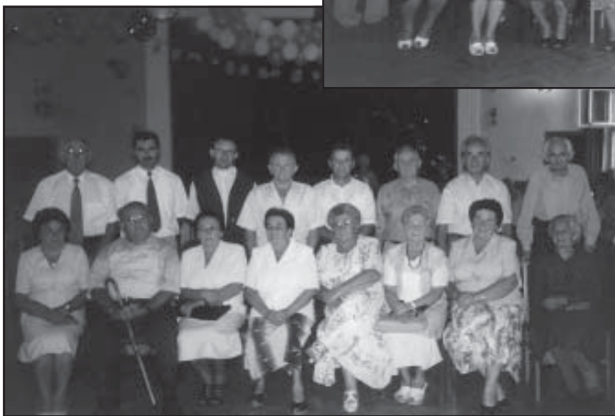
Świętujące jubileusz pary małżeńskie.