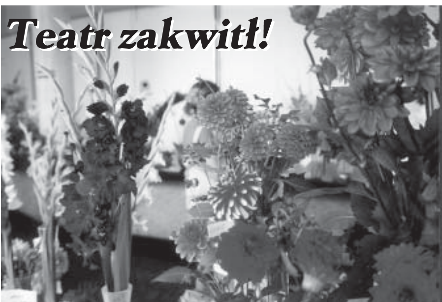
W TZR królowały mieczyki i dalie.