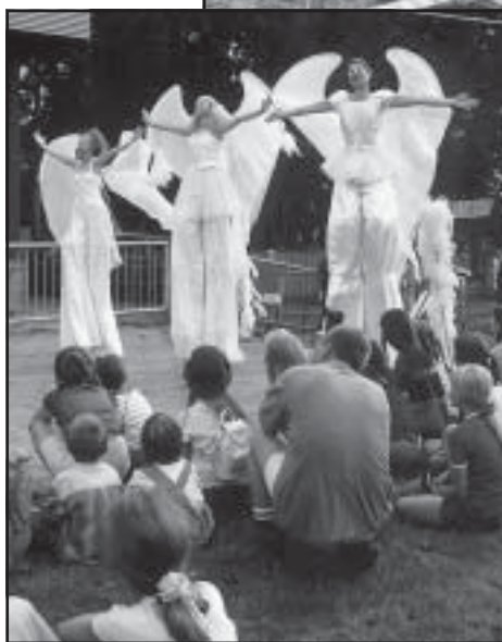
Anioły spłynęły do Boguszowic...