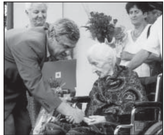
Szacowna jubilatka z Brzezin.