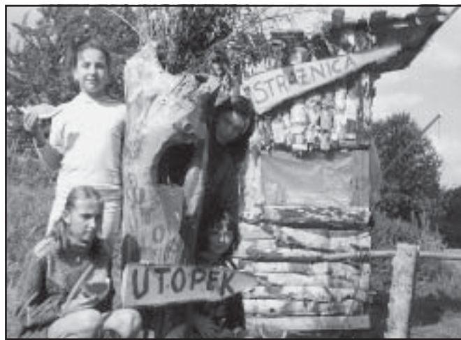
Wejścia do obozu strzegł utopek.

Podobnie jak w latach ubiegłych MOSiR w Kamieniu przygotował akcję pod hasłem „Lato Dzieciom”.