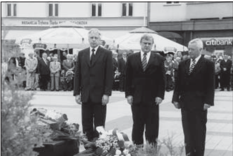
Delegacja władz miasta składa kwiaty na płycie upamiętniającej pobyt marszałka Józefa Piłsudskiego w Rybniku.

i medale za Zasługi dla Obronności Kraju oraz medale Siły Zbrojne w Służbie Ojczyzny, a uczestniczące w uroczystości delegacje złożyły kwiaty na płycie upamiętniającej pobyt marszałka Józefa Piłsudskiego w Rybniku. Całość uświetniła obecność kompanii honorowej straży granicznej oraz występ Miejskiej Orkiestry Dętej „Rybnik”.