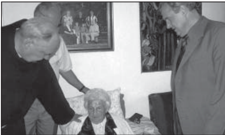
102-latka ze Smolnej.