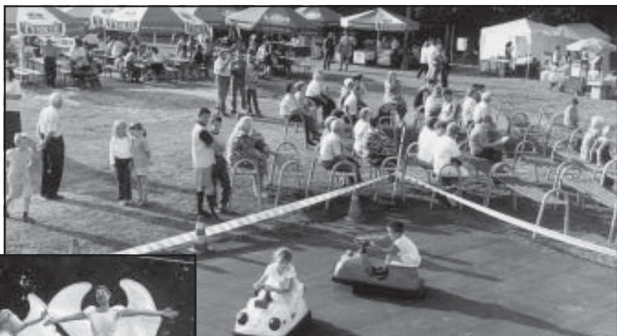
Tak bawili się mieszkańcy Ochojca.

Organizowane w Wielopolu dni tej dzielnicy, upłynęły głównie pod znakiem sportu.