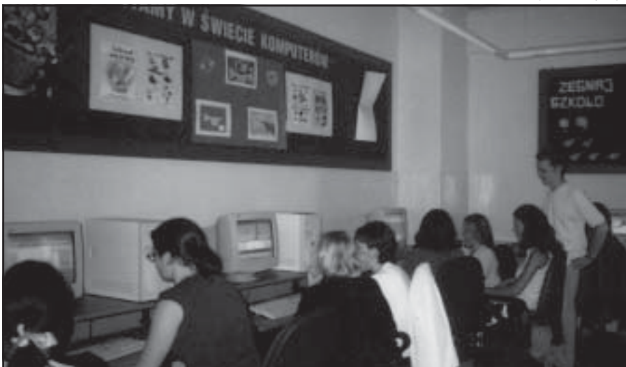
W programie „Wakacje z komputerem” wzięły udział jedynie dziewczyny.